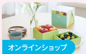
オンラインショップ

オリジナルレシピや、特徴・栄養がわかる図鑑コーナーをインターネットで発信しています。